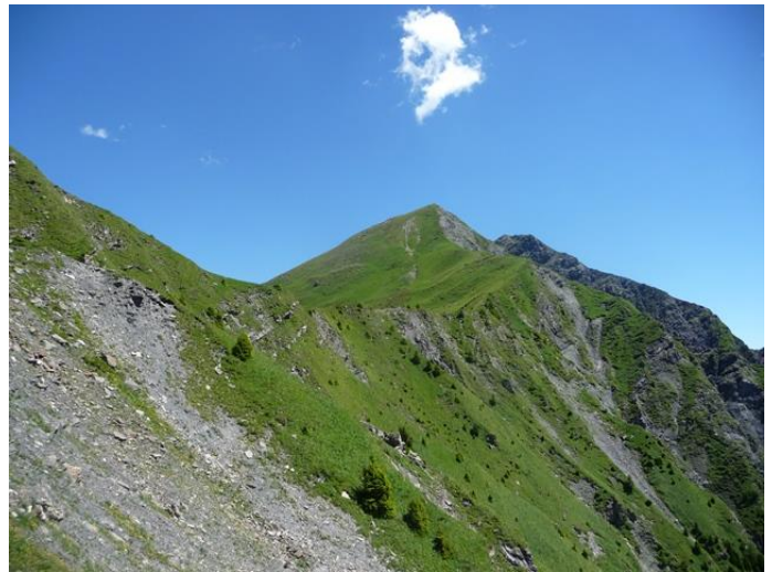
Blick unterhalb des Messhaldenspiz zum Gratweg auf den Vilan