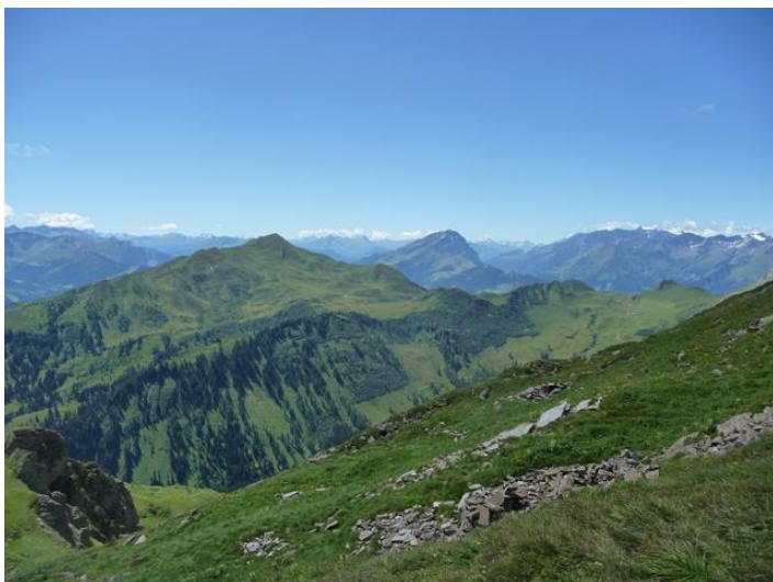
Blick vom Barthümeljoch zurück zum Vilan und zum Calanda