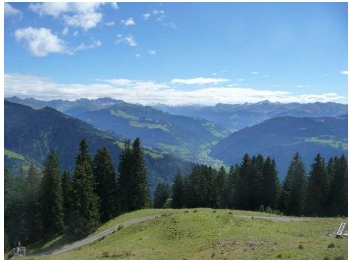
Oberhalb Sadreinegg mit Blick ins Prättigau