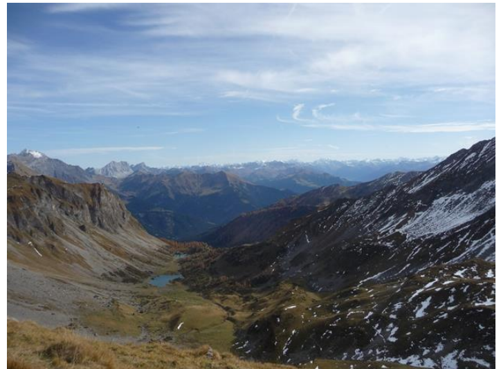
Blick oberhalb Fläscher Fürggeli zu den Seen und in den Rätikon