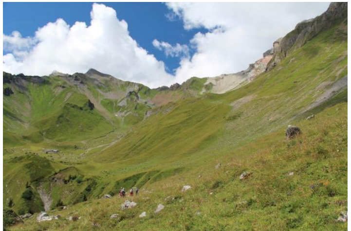
Blick unterhalb Barthümeljoch zur Maienfelder Alp Ijes