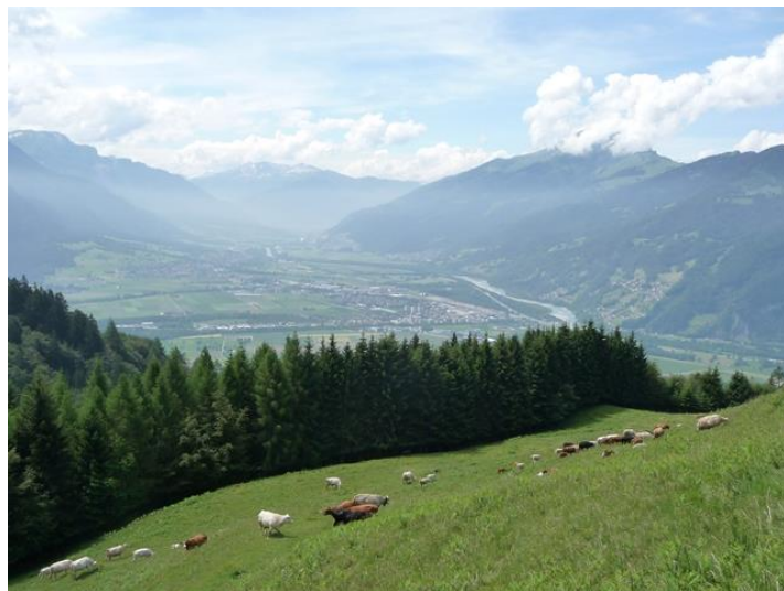
Blick beim unteren Heuberg ins Rheintal und zum Calanda