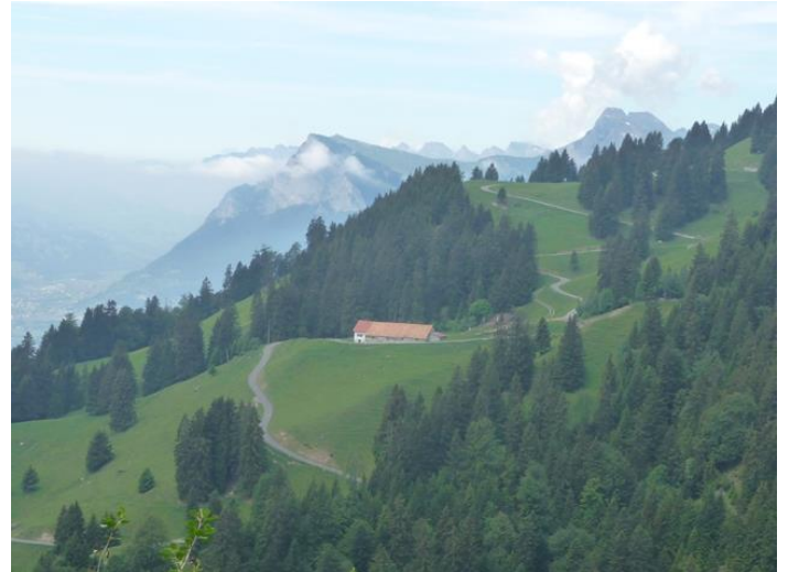
Blick zur Jeninser Alp Untersäss und ins Sarganserland